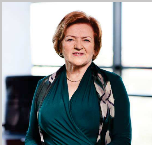
Prezes Zarządu Ecovis Poland Audit, Tax & Accounting Sp. z o.o.

Jesteśmy dumni z szerokiej bazy klientów, którzy nam zaufali i pozostają z nami od wielu lat.